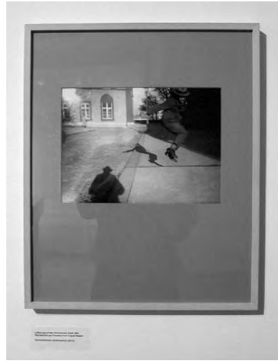
ABB.6 – 10 Ausstellungsdokumentation

Weil die Bilder im Album sehr klein sind und sie ihr Motiv, die Familie, stets neu zusammenstellen und in andere Kontexte verschieben, bleiben sie diesem innig verbunden. Die Ereignisse, Erlebnisse, wie auch deren Flüchtigkeit werden im Fotoalbum quasi doppelt eingeschlossen – der Ledereinband begegnet zusätzlich der Vergänglichkeit der Fotografie. Die Aufnahmen sind denn auch nicht für eine anhaltende Betrachtung gedacht, sondern bestehen auf diesem evokativen Moment, dem Aufblitzen des fast schon Vergessenen. Dies kann auch in der Ausstellung nur geschehen, wenn die Bilder eingebettet bleiben, wenn der Bildrahmen, die Seitenumgebung, die handschriftlichen Legenden und nicht zuletzt die Spiegelung im Deckglas die Betrachtung erschweren und Entdeckungen ermöglichen. ABB.7 Ausstellen bedeutet in dieser Inszenierung nicht nur exponieren, sondern auch verbergen. Allein in dieser paradoxen Verschachtelung signalisiert und bewahrt sich eine gewisse Intimität.