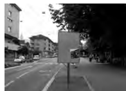
ABB.7A → TAFEL AA.7, S. 94

In den aufgeschlagenen Familionalben sind insgesamt rund 700 kleinformatige Fotografien zu sehen. Rechnet man jene Bilder dazu, die sich unsichtbar auf den nicht aufgeschlagenen Seiten befinden, dann verbirgt die Ausstellung mehr Bilder als sie zeigt. Auf ihnen bildet sich die Geschichte fort, die nur in ein paar belichteten Momenten zu sehen ist. Und selbst von den sichtbaren Bildern wird der Besucher nicht alle wahrnehmen können wegen der schieren Anzahl, den relativ kleinen Formaten, aber auch der gebückten Haltung wegen, die die niedrigen Auslagen dem Betrachter abverlangen. So wird er sich den ersten Alben ausführlicher widmen, um dann im weiteren Verlauf nur noch punktuell einige Bilder auszuwählen, vielleicht mit Hilfe des streuenden Blickes, der darauf wartet, dass ihn die Objekte anrühren. «Ich stelle mir vor, dass für alle Besucher einzelne Bilder wie